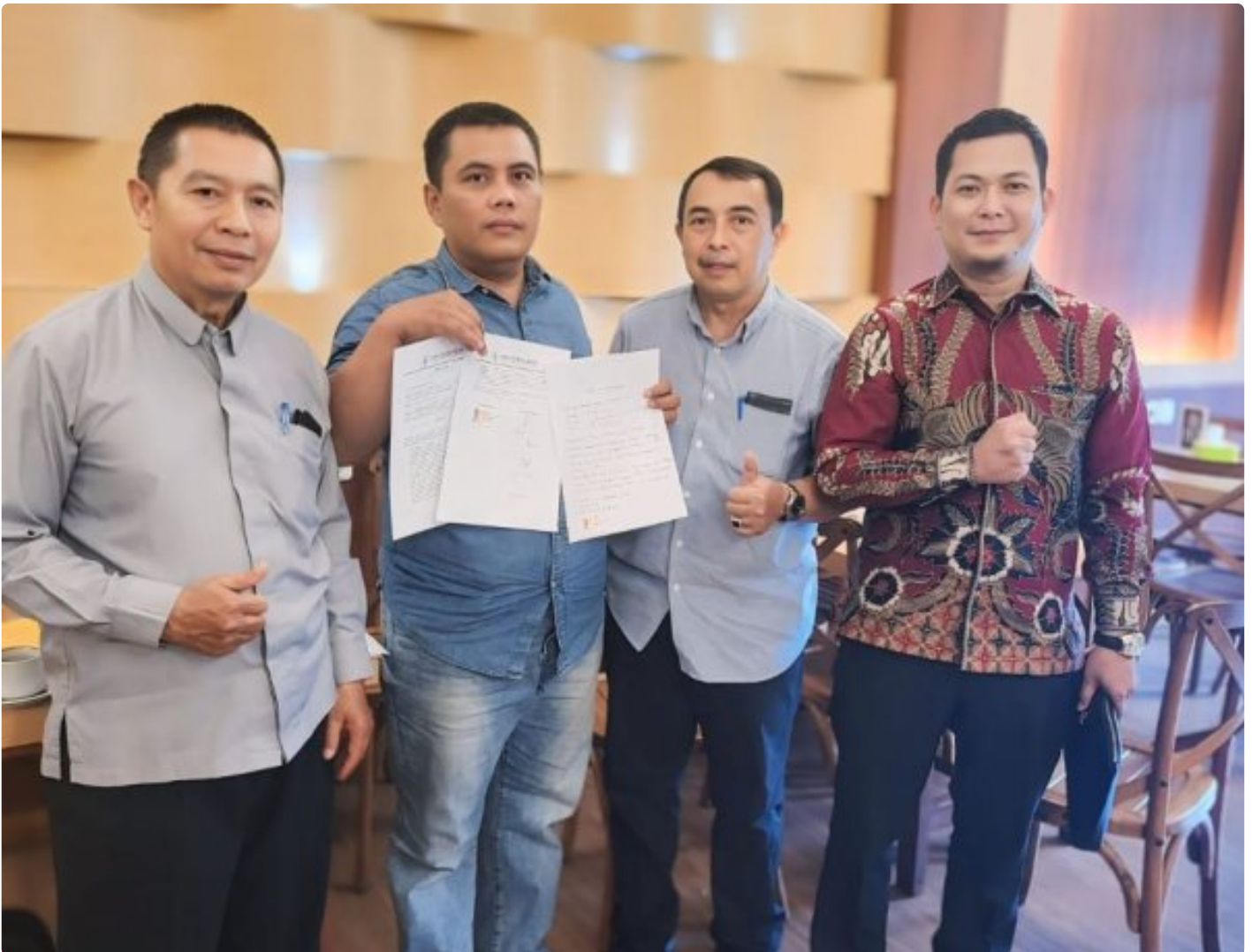
Kuasa Hukum Ningto Wahyu Dens & Partners Lawfirm di perkara Dugaan Pemalsuan Data dan Kredit Fiktif di Bank BRI Unit Kalideres.

JAKARTA, JNI - Seorang bekas nasabah Bank BRI, yang dikenal dengan inisial NW, melaporkan dugaan pemalsuan data dan kredit fiktif yang melibatkan oknum